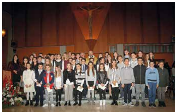
Gruppo dei cresimati del 19 novembre